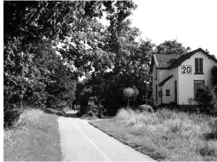
Het Bels Lijntje bij Baarle is nu als fietspad nog zichtbaar.