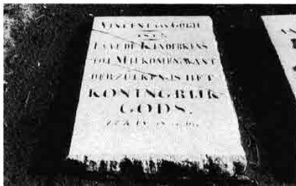
Overlijdensakte levenloos kind van Theodorus van Gogh (1852)