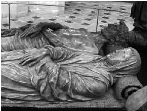
Het praalgraf van Engelbrecht II van Nassau in de Grote Kerk