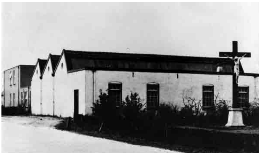
Confectieatelier Milo in Mierlo-Hout