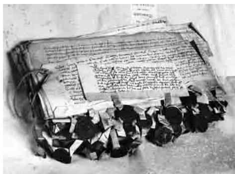
Middeleeuwse charters van de fundatie voor Oude Vrouwtjes van de stad Heusden werden in 1977 nog in een lias samengebonden aangetroffen.

Het opkomen voor ons erfgoed begint met het leggen en onderhouden van goede contacten, contacten tussen Brabants Heem, de archiefdiensten en musea en collecties. Brabants Heem kan ondersteuning bieden dan wel zorgvragers de weg wijzen. Brabants Heem wil daar waar nodig en mogelijk steun bieden, maar ook de vinger aan de pols houden bij bedreiging van datzelfde erfgoed. In tijden van globalisering is er nog méér dan voorheen behoefte aan kennis van de eigen leefomgeving, de streek, de provincie.