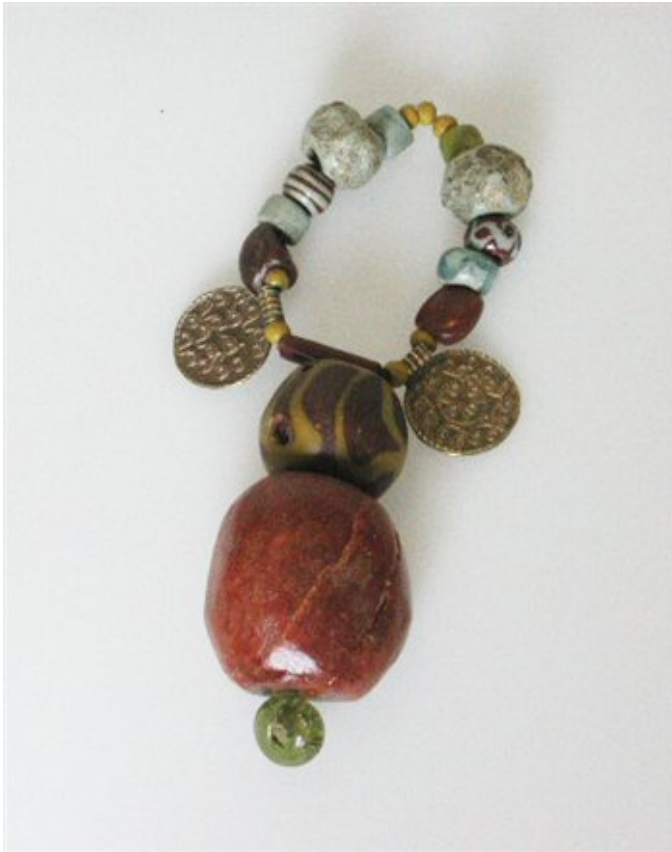
Afbeelding 3. Kralensnoer uit Alphen Noord-Brabant

Kralensnoeren zijn er in vele variaties. Het hier afgebeelde kralensnoer uit Alphen werd waarschijnlijk rondom de arm gedragen. Er waren ook kralensnoeren die om de hals of rondom het middel werden gedragen.