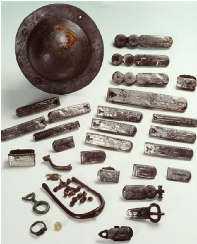
Afbeelding 8. Grafvondsten uit Geldrop