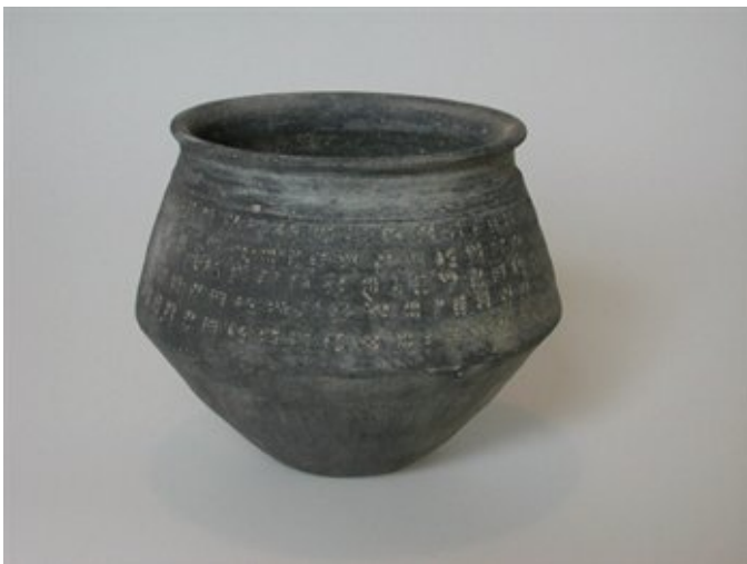
Afbeelding 11. Grafvondst uit Meerveldhoven, grijs bakkend aardenwerk pot met radstempel versiering