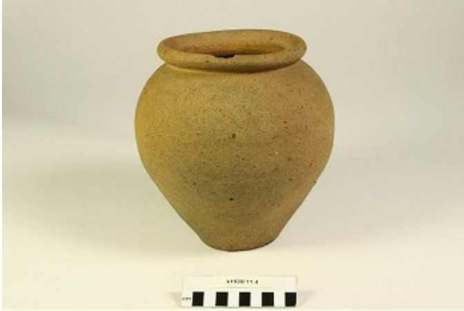
Afbeelding 12. Grafvondst uit Bergeijk, Westerhoven Ruwwandige kookpot met dekselgeul.