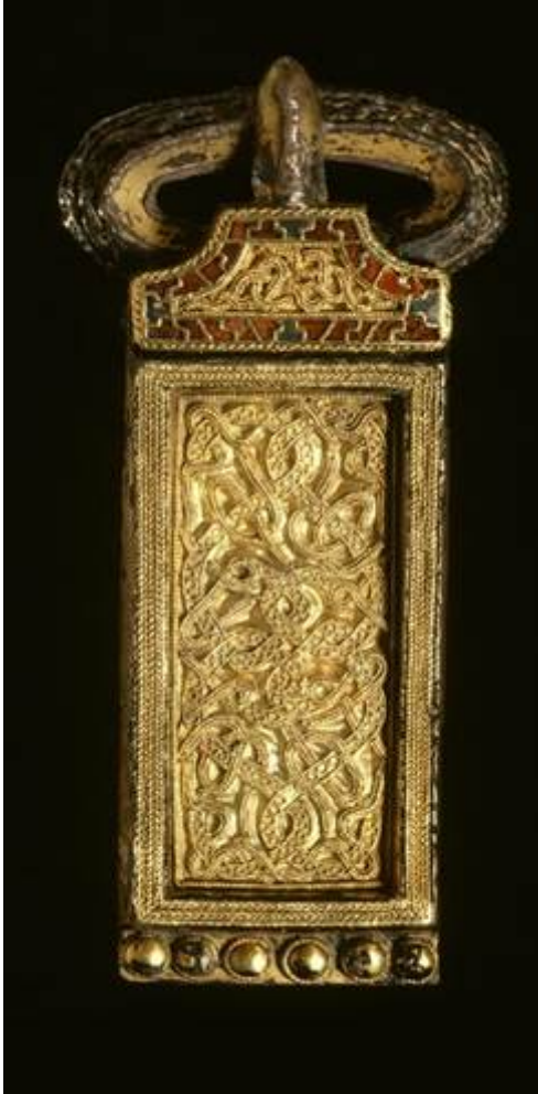
Afbeelding 6. Gordelgesp uit Rijnsburg 630-640