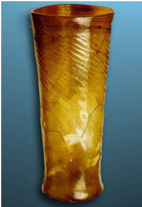
Afbeelding 5. Glazen beker uit Bergeijk