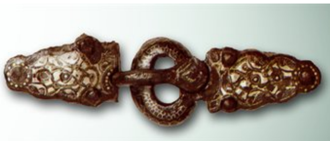
Afbeelding 1. Gesp met riembeslag uit Ravenstein

Met name de oorzaken van deze ontvolking worden besproken. Hoe waarschijnlijk is het dat oorlogvoering, besmettelijke ziekten of bodemdegradatie, die in diverse bronnen worden genoemd, verantwoordelijk zijn voor de desastreuze ontwikkeling? Vervolgens komt de herbevolking in de late 4 e /vroege 5 e eeuw aan de orde. Wat weten we over de herkomst van de bewoners van die nederzettingen?