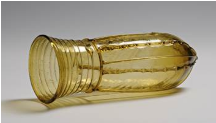
Afbeelding 4. Fraaie buidelbeker uit Bergeijk

De perfect bewaarde lichtgroene buidelbeker, in 1957 gevonden in Bergeijk, is misschien wel het mooiste Merovingische glas van Nederland. Maar recent is in Uden ook een buidelbeker gevonden, van heel donkerblauw glas, de derde buidelbeker in ons land!