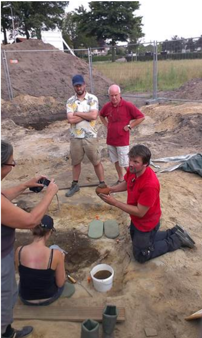
Afbeelding 7. Opgraving te Uden 2014.