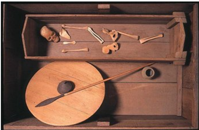
Afbeelding 13. Reconstructie van een Merovingisch grafkamer

De grafvondsten in de soms rijk gevulde graven zijn de belangrijkste materiële getuigenissen uit dit tijdvak van de Brabantse geschiedenis.