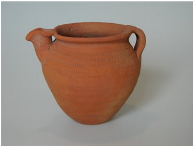
Afbeelding 10. Grafvondst uit Meerveldhoven, rood bakkend aardenwerk kan met radstempel versiering