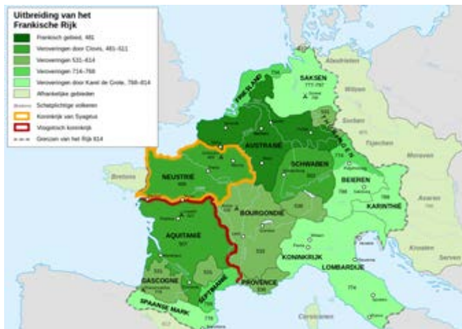
Abbeelding 14. Ontwikkeling van het Frankische rijk.

Met het bestijgen van de Frankische troon door Merovech in 447 begon de Merovingische dynastie die het Frankische Rijk tot 751 zou regeren. Het duurde echter nog tot 482, het jaar waarin de beroemde koning Clovis de Frankische troon besteeg, voordat alle Franken onder één leider verenigd waren. Hij wist zijn Frankische tegenstanders te verslaan en won daarmee de alleenheerschappij. Tien jaar na het afzetten van Romulus Augustulus als laatste Romeinse keizer in West-Europa versloeg Clovis in 486 de 'Romeinse generaal' Syagrius (eigenlijk een plaatselijke krijgsheer) bij Lutetia, het huidige Parijs, zodat de rest van Gallië in zijn handen viel. Clovis bracht zijn hofhouding over naar Lutetia en het hele gebied van Gallië erfde uiteindelijk de naam "Francië" van hun nieuwe heersers. Parijs is sinds Clovis ook het bestuurlijke centrum van Frankrijk.