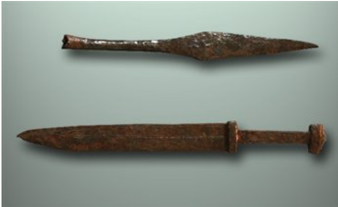
Afbeelding 9. Grafvondsten uit Meerveldhoven Speerpunt en zwaard

het opgraven en uitwerken van heropende graven. Tot slot worden verschillende mogelijke verklaringen voor het heropenen van graven besproken.