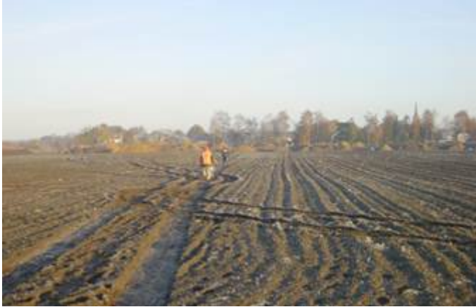
Afbeelding 2. Opgraving te Alphen Noord-Brabant.